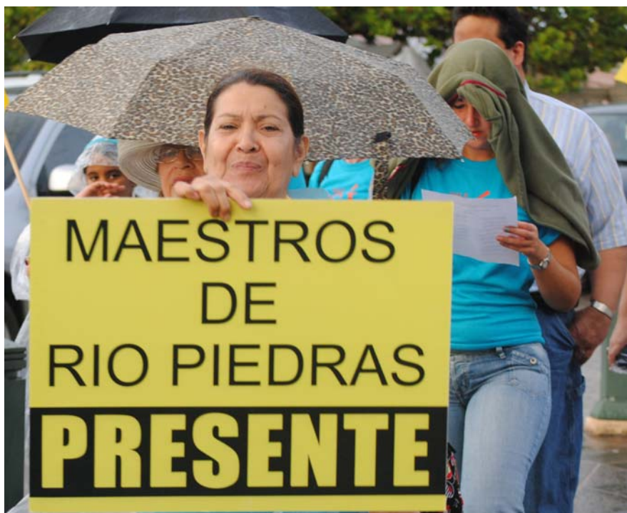
Al unísono, los maestros reclamaron: «Elección sindical ahora», el pasado 4 de mayo.

La urgencia de la AMPR para que se celebre la elección sindical en el DE responde a que por ser año electoral, el 1ro. de julio inicia la veda electoral que prohíbe las negociaciones de convenios colectivos.