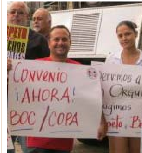
Los unionados de Bridge of the Caribbean (COPA) exigen la firma de su primer convenio colectivo.

Además, las mencionadas centrales obreras y nuestra FTPR-AFL-CIO aprobaron una resolución para demandar en la actividad del Primero de Mayo la excarcelación del patriota Oscar López. Éste ha permanecido más de 30 años encarcelado en Estados Unidos por luchar por la independencia de Puerto Rico.