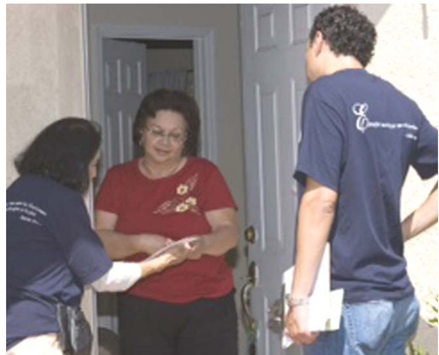
El LCLAA educa y orienta a los votantes latinos durante los procesos de inscripción y de votación, exhortándolos a ejercer sus derechos al voto y a la participación en todo el proceso político, no solo en las elecciones.

• El LCLAA destaca la presencia y la acción del movimiento obrero entre la comunidad latina,