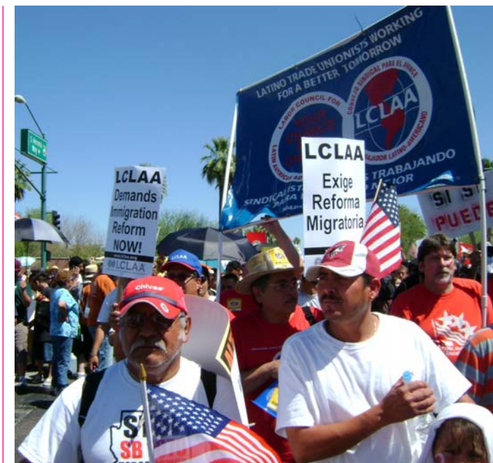
El LCLAA ha sido un constante promotor y defensor de una reforma migratoria justa, y un tenaz luchador contra el discriminación y el prejuicio anti-latino que parece cobrar fuerzas en Estados Unidos.

La Conferencia abordará la situación actual de las familias trabajadoras latinas en Estados Unidos, así como las acciones que serán necesarias para promover la prosperidad entre la clase trabajadora.